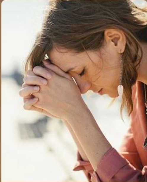
Take a rest