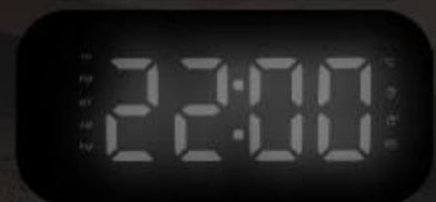
First gear (highlighted) Second gear (medium bright) Third gear (low light)