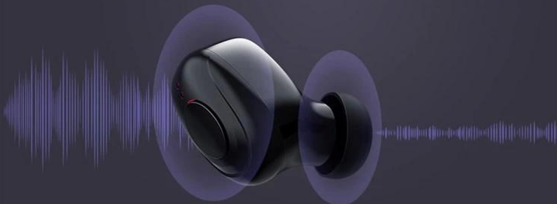
▲ Before noise reduction