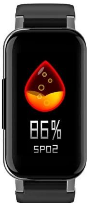
Blood oxygen test