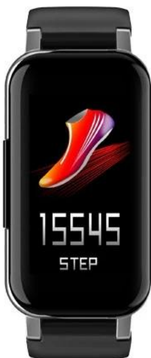
Accurate step counting