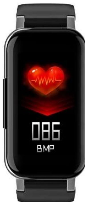
Heart rate test