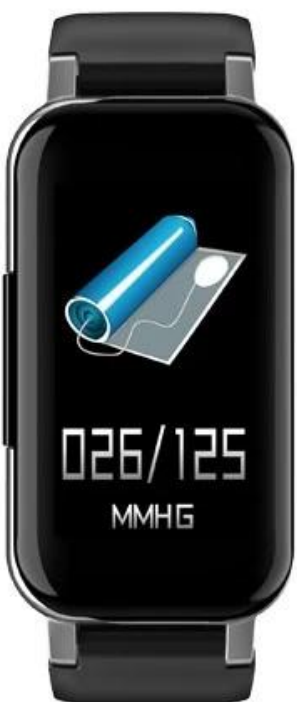
Blood pressure test