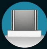
Type - C interface