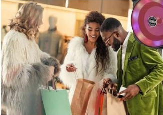
Shopping for dinner