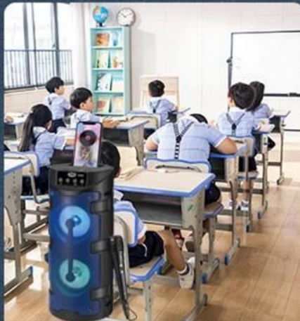
4. The lecturer