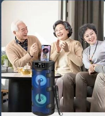
1. Family reunion