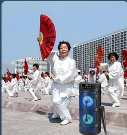
3. Square dancing