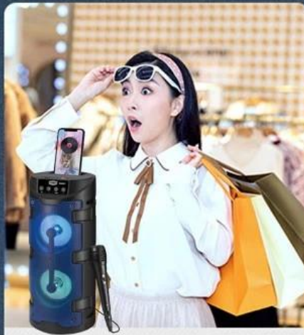
2. Store sales promotion