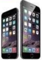
for iPhone 6S/6S Plus