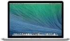
for apple notebook