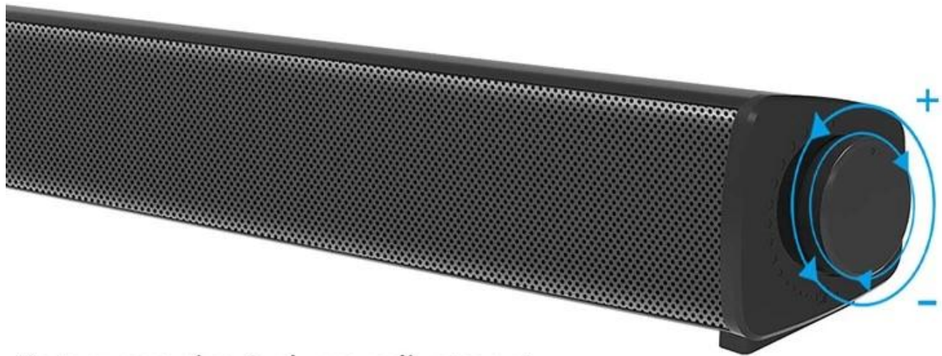
Rotary opening/volume adjustment