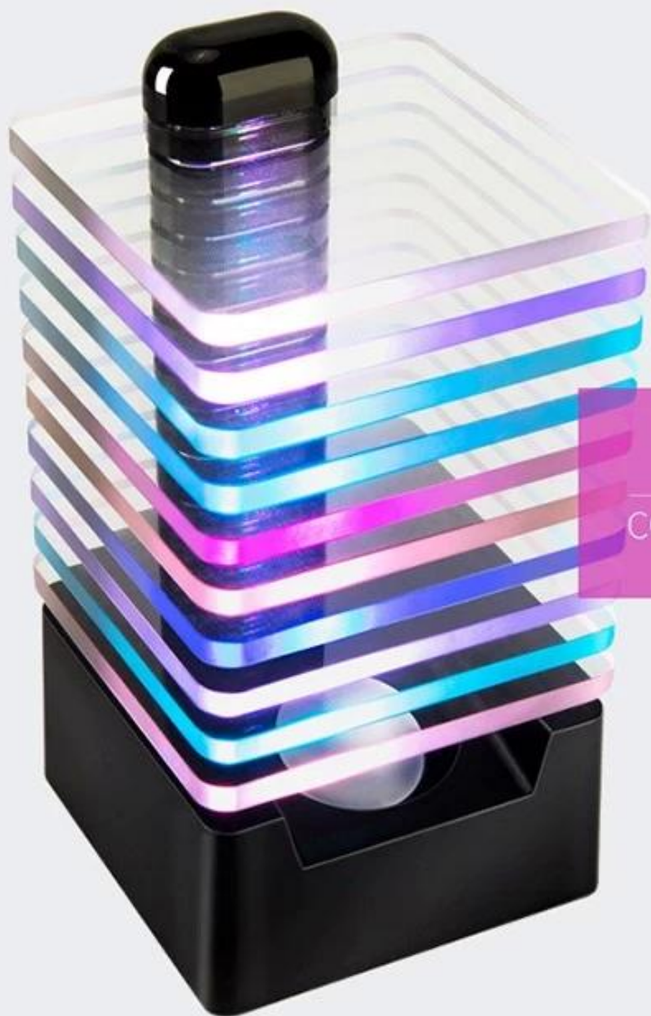
COLOURFUL LIGHT TUBE