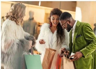
Shopping for dinner