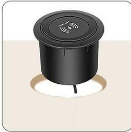
Put the wireless charger into the hole