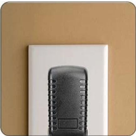
Connect to Power

Put the wireless charger on the edge of the desktop