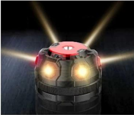
6 Amber color SMD LED flash for car emergency