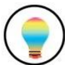
Multi - Lamp